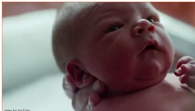
Video fra YouTube